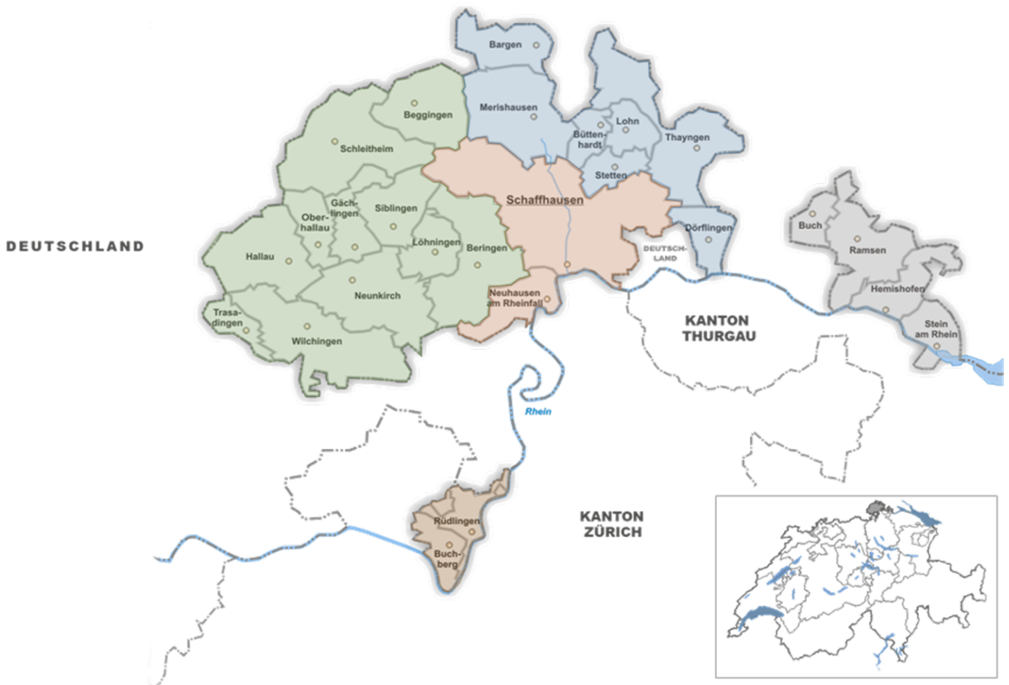
Abbildung 1: Die Regionen des Kantons Schaffhausen

Topografisch liegt der Kanton Schaffhausen am Rande des schweizerischen Mittellandes. Seine sanften Hügel und Täler gehören zu den Ausläufern des Juras und zeugen von den Gletscherbewegungen während der letzten Eiszeit. Das Landschaftsbild ist vielseitig und wird im Besonderen durch den Rhein mit seiner einzigartigen Flusslandschaft, den grossen Waldgebieten, dem weiten Ackerland und den sorgfältig gepflegten Weinbergen geprägt.